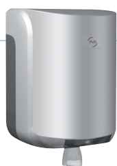
REF 8 99 736 Cleanline Dévidoir maxi capot gris métal UL 1 : 6