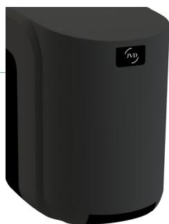
REF 8 99 1383 Cleanline Dévidoir maxi noir UL 1 : 6