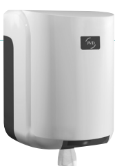
REF 8 99 605 Cleanline Dévidoir maxi capot blanc UL 1 : 6