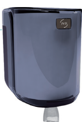
REF 8 99 737 Cleanline Dévidoir maxi capot transparent fumé UL 1 : 6