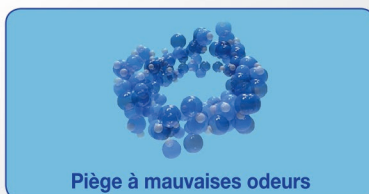
Piège à mauvaises odeurs