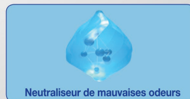
Neutraliseur de mauvaises odeurs